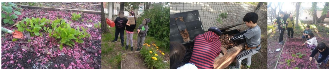
Figura 1. Imágenes de las actividades realizadas en la Escuela N°120 "Herminia Brumana, La Plata, Buenos Aires.

Esta experiencia de Educación Ambiental y Soberanía Alimentaria, cuenta con el aporte del Proyecto "Semillas Locales" de la Facultad de Ciencias Agrarias de la UNLP en el aporte de semillas y encuentros de intercambio y formación, el Programa ProHuerta del INTA con semillas y la Red de Huertas Escolares de la FCEyN de la UNMDP con actividades de intercambio y formación.