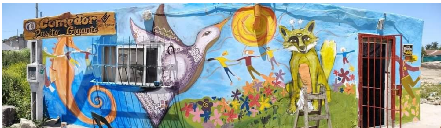
Figura 1. Mural participativo realizado por un colectivo de artistas en el comedor “Pasito gigante”.

alimentario como derecho. Es una gran oportunidad para cuidar y producir en un espacio verde, socializar y afianzar vínculos. Nuestro objetivo general es crear una huerta comunitaria dentro del Comedor como experiencia desde la cual producir y obtener alimentos sanos e indispensables para la alimentación de las familias que concurren al mismo y, asimismo, fortalecer la convivencia comunitaria. Para ello, nos proponemos trabajar sobre lo vincular, fomentar una alimentación saludable y replicar la práctica hortícola en otros espacios (comedores, escuelas, centros culturales, comedores, plazas, centros de salud y de día, etc.), explicando a las familias sobre la importancia que tiene una alimentación saludable sobre el bienestar físico, psíquico y social en todas las edades. Resulta fundamental promover actividades grupales y presenciales desde un trabajo colectivo en equipo y que, además, interesen a niñas/os y adolescentes posibilitando con ello disminuir el uso excesivo de redes virtuales (adicción a las redes y también a sustancias), acompañando a su escolaridad y mejorar el