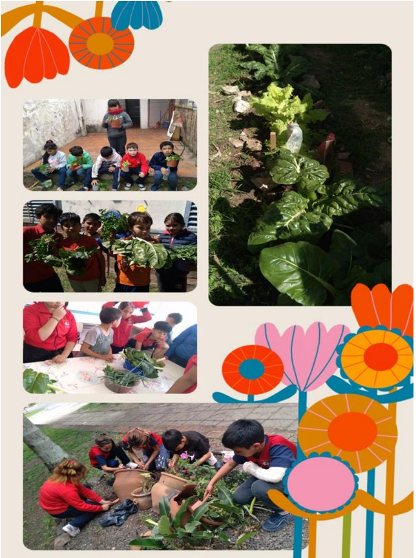
Figura 1. Actividades realizadas en la escuela N°9 Juan Bautista Azopardo de Santa Elena, Entre Ríos.