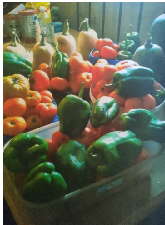
Figura 1. Cosecha del comedor “La Torre”.

Es increíble que esas semillas tan pequeñas nos ayudaran tanto. A partir de esa primera experiencia, no dejamos de hacer huerta y fue una lucha hasta que aprendimos sobre las plantas, sus cuidados y cuánto pueden significar como alimento que nos nutre también en solidaridad. No es necesario tener un espacio grande de tierra para producir las propias verduras. Es así que nuestra huerta se transformó en proyecto