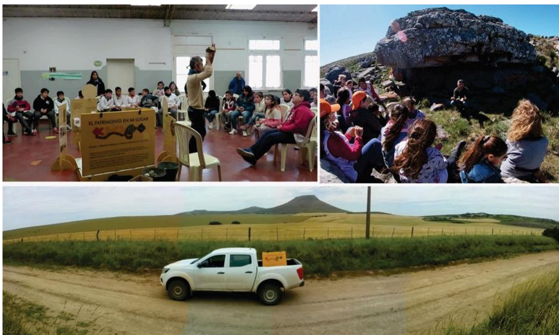
Figura 1. Actividades desarrolladas en clase, en sitios arqueológicos del paisaje serrano y el traslado de uno de los dispositivos pedagógicos de una escuela a otra, con el sitio arqueológico Cerro El Sombrero, de 12.000 años de antigüedad de fondo.

Y aún más: reunir esa información y componer pequeñas exposiciones itinerantes que vuelvan a los museos en