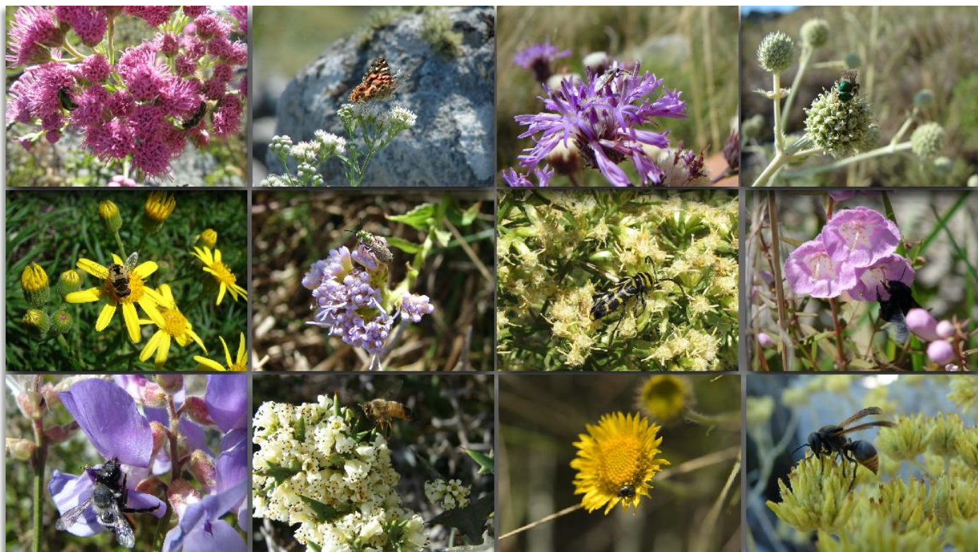
Figura 1. Plantas nativas de las sierras de Tandilia y sus visitantes florales

Además de los polinizadores en las flores, en otras partes de las plantas también se encuentran insectos benéficos que ayudan a controlar las especies consideradas plagas. Este es el caso de las vaquitas de San Antonio y de las larvas de los sírfidos (grupo de moscas que visitan las flores), que se